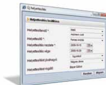
A helyettesítésekre is gondoltunk

Arra is gondoltunk, hogy munkatársai rendszerint ugyanazokat a – szerepkörükhöz kötődő – szűréseket végzik el. A menthető keresések segítségével nem kell napról napra feltételek tucatjait beállítani. Az elmentett keresések később egyetlen kattintással – akár dinamikus feltételeket is rögzítve – elérhetővé válnak.