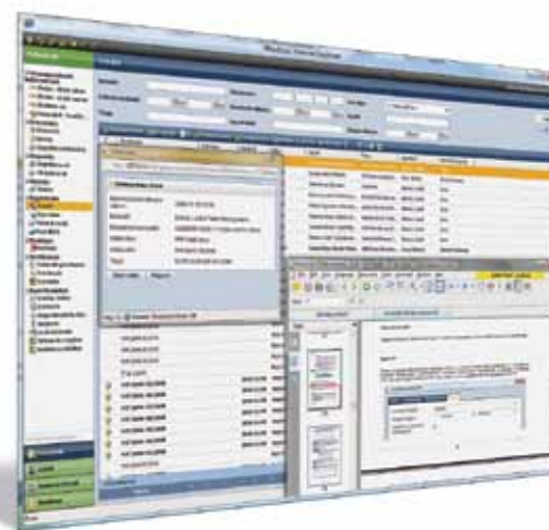
A DMSone Ultimate dokumentumkezelő rendszer segítségével néhány kattintással elvégezhetjük a beérkező dokumentumok érkeztetését