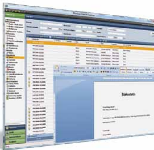
A rendszer lehetőséget biztosít a felhasználóknak az általuk használt funkciók teljes testre szabására, így egyszerűsíthetik legösszetettebb feladataikat is

A vállalat méretétől, vagy akár adminisztrációs feladatokhoz való viszonyulásától függően bizonyos dokumentumkezelési folyamatok összevonhatók, vagy részekre bonthatók, különböző munkatársakhoz delegálhatók.