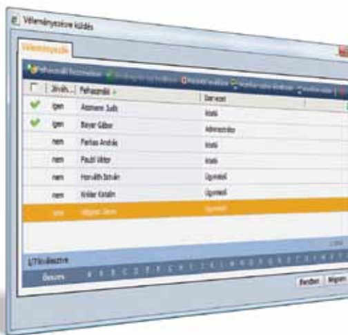
Egymással párhuzamosan, szerepkörtől függetlenül véleményezhetik, illetve jóváhagyhatják a rendszerben elektronikusan létező dokumentumot a munkatársak

Munkatársaink akár párhuzamosan, mégis egymástól függetlenül véleményezhetik , illetve jóváhagyásukkal igazolhatják a rendszerben lévő elektronikus dokumentumokat. A rendszer lehetővé teszi az elektronikus számlaigazolást, szerződés aláírást. Munkatársaink egymást követően, a szervezeti hierarchiát modellezve is továbbíthatják az adott dokumentumot, illetve annak automatikusan rögzített példányait.