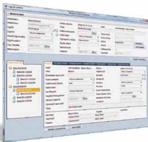
Az áttekinthetőség és tetszetős design a rendszer egészére jellemző

A központi adatbázisban tárolt tartalom, formátumától és méretétől függetlenül, egységesen kezelhető – vállalatumk, illetve saját szempontjaink szerint .